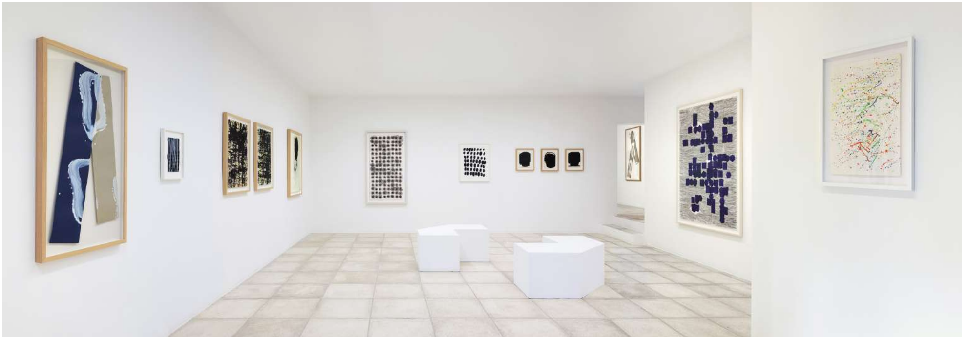
Renverser la tache • © François Fernandez • 2024