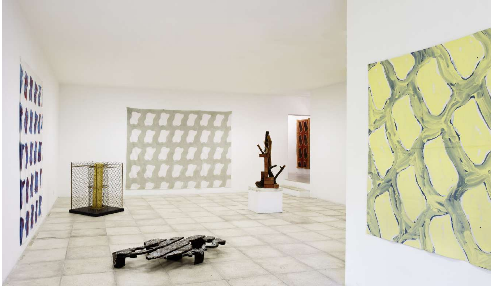
L'art contemporain et la Côte d'Azur • Bernard PAGÈS • Claude VIALLAT • Tatiana WOLSKA • © François Fernandez • 2011