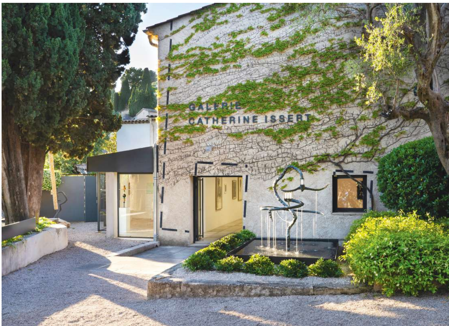
Vue de la galerie Catherine Issert • avril 2024

Gautier FERRERO • Yatra • 2023 • bronze • Fontaine en circuit fermé • 160 x 125 x 125 cm