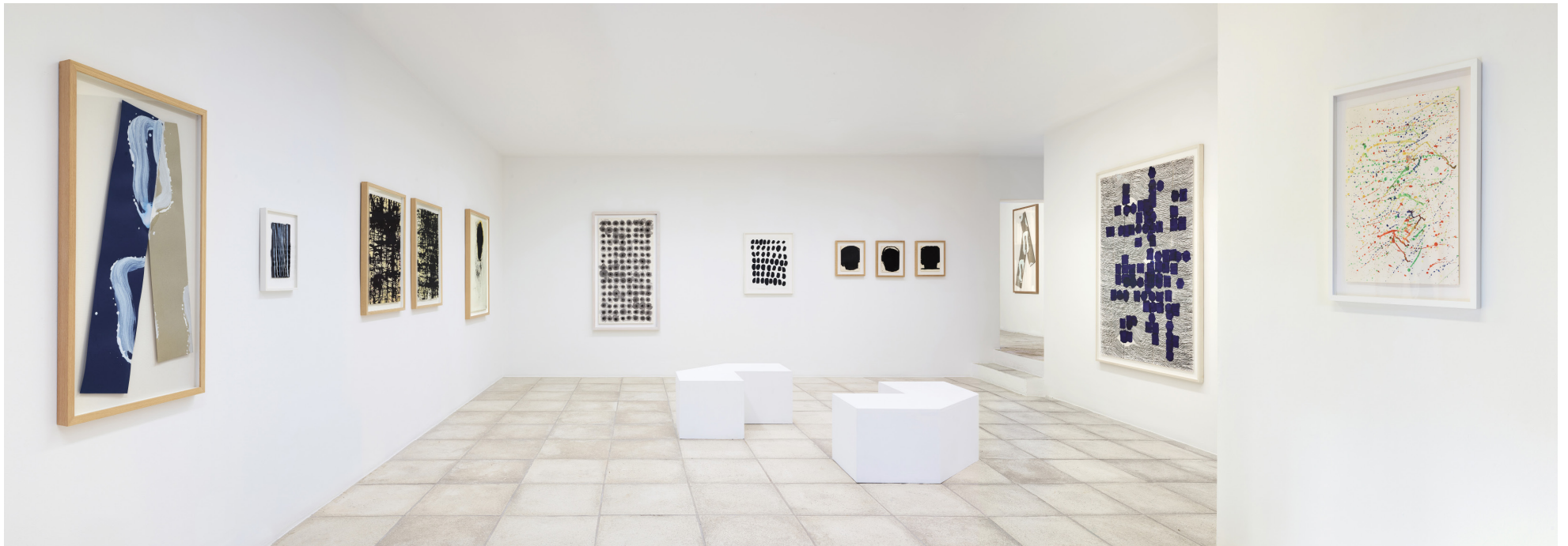
Renverser la tache • 2024