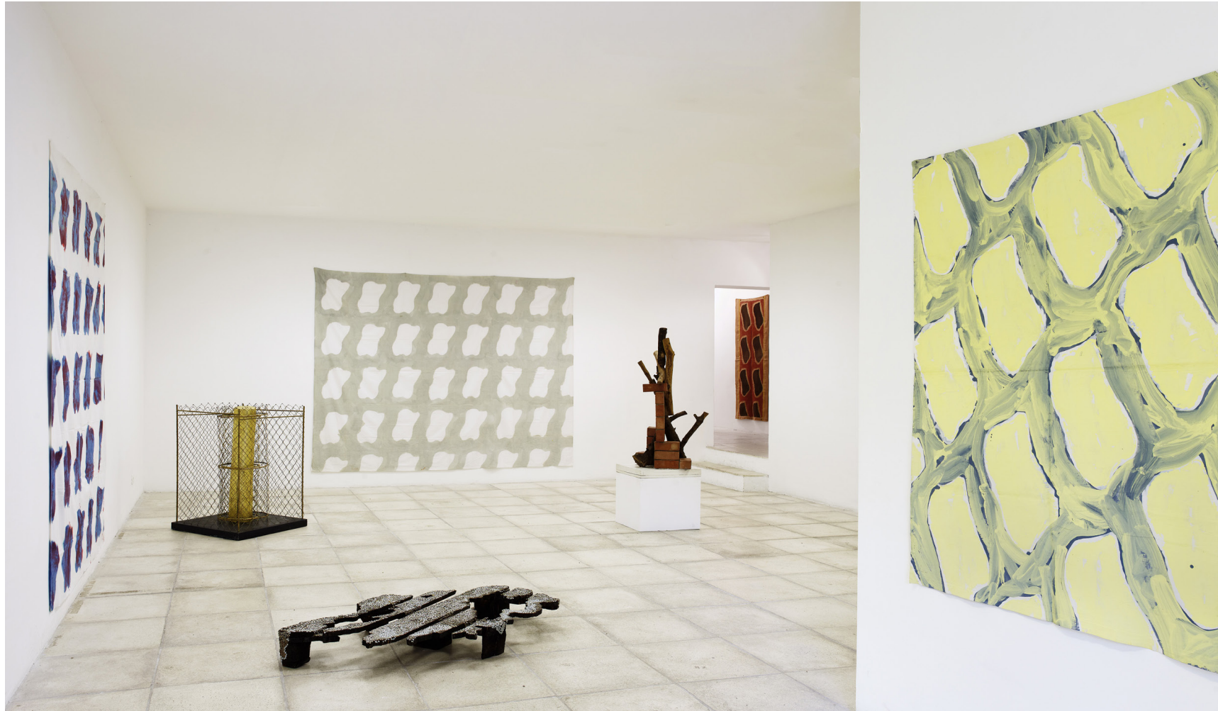
L'art contemporain et la Côte d'Azur • Bernard PAGÈS • Claude VIALLAT • Tatiana WOLSKA • © François Fernandez • 2011