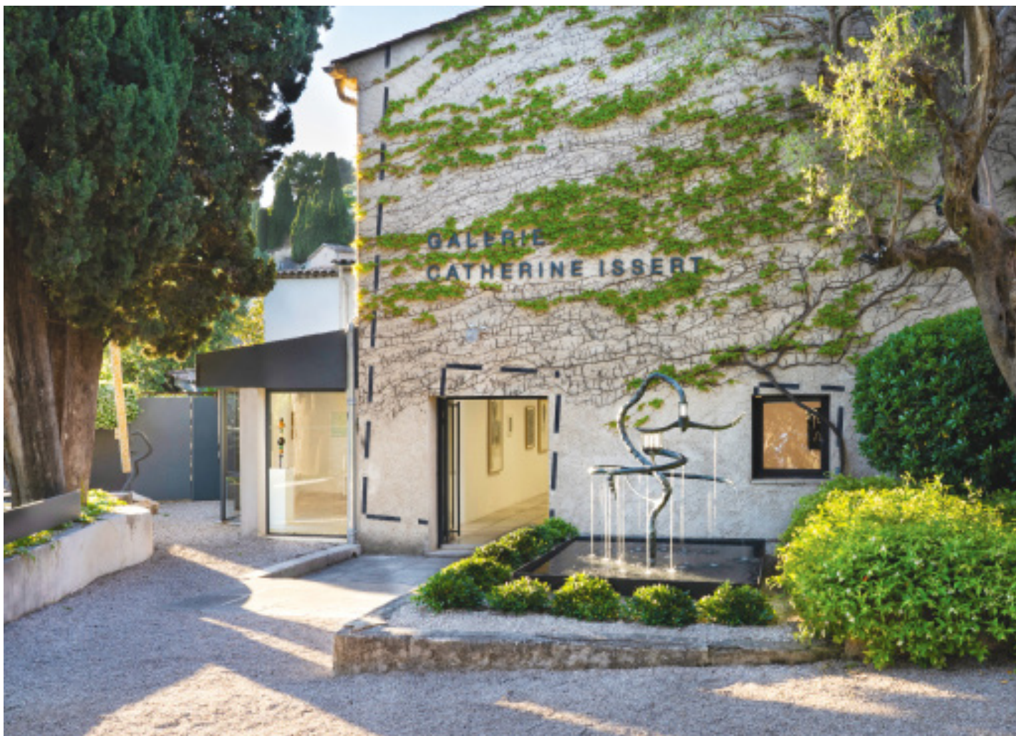
Vue de la galerie Catherine Issert • avril 2024

Gautier FERRERO • Yatra • 2023 • bronze • Fontaine en circuit fermé • 160 x 125 x 125 cm